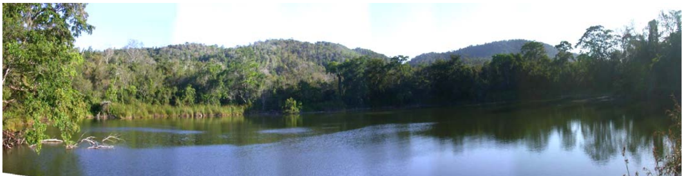
Fuente: Bitopo Dos Lagunas Reserva Transfronteriza Guatemala

Guatemala cuenta entre sus áreas protegidas transfronterizas trinacionales Las Reservas de Biosfera: Maya (México y Belice) y la Fraternidad o Trifinio (Salvador y Honduras) y otras áreas binacionales. La Reserva de Biosfera con 2,112,940 Ha. Maya es la mayor área protegida de Centro América, y forma parte de la Selva Maya (México, Guatemala y Belice), la reserva de bosque tropical más grande de la región. Su valor estratégico para el