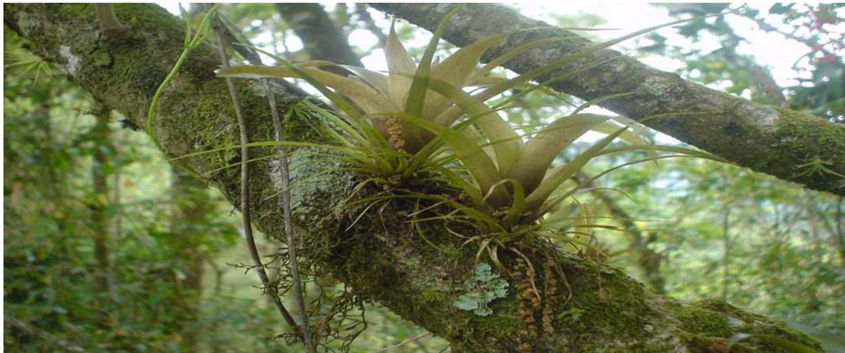
Fuente: Bosque Nuboso, Reserva de Biosfera la Fraternidad (Guatemala, Salvador, Honduras) Foto: Nigte Ordoñez, Investigadora asociada CDC-GT

Guatemala es parte de la región Centroamérica conformada por 7 países (Guatemala, Belice, Honduras, el Salvador, Nicaragua, Costa Rica y Panamá) cuya extensión territorial es de 533,000 Km 2 .