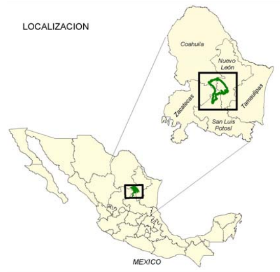
CPIC Pronatura Noreste