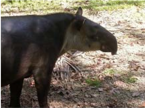
Tapir centroamericano ( Tapirus bairdii )

El tapir centroamericano ( Tapirus bairdii ), conocido también como danto(a), macho de monte o Tixl (en idioma Q'eqch'i) es el único representante extante nativo del Orden Perissodactyla (al que pertenecen también caballos y rinocerontes), para la región Mesoamericana (Emmons 1990, Reid 1997). Este mamífero, abundante y ampliamente distribuido durante el mioceno (Gamero 1978), se halla ahora en grave peligro de desaparecer de los sitios en los que habita, sin siquiera conocerse el rol que desempeña dentro de los procesos naturales de los bosques.