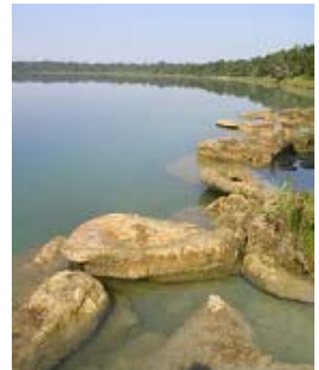
Vista de la Laguna Lachuá, Parque Nacional Laguna Lachuá, Alta Verapaz, Guatemala.

Durante los años 2004-2005, la Escuela de Biología realizó dos investigaciones sobre esta especie en el Parque Nacional Laguna Lachuá, Alta Verapaz, Guatemala. En una de ellas se estudió la abundancia poblacional y el uso de hábitat, en el cual se encontró que este mamífero tiene mayor preferencia por las áreas inundables (Ruiz 2006). En la otra investigación, se estudió la dieta y el hábitat en ecosistemas ribereños, encontrándose que la dieta del tapir está compuesta principalmente por hojas y que consume al menos 49 especies vegetales (García 2006).